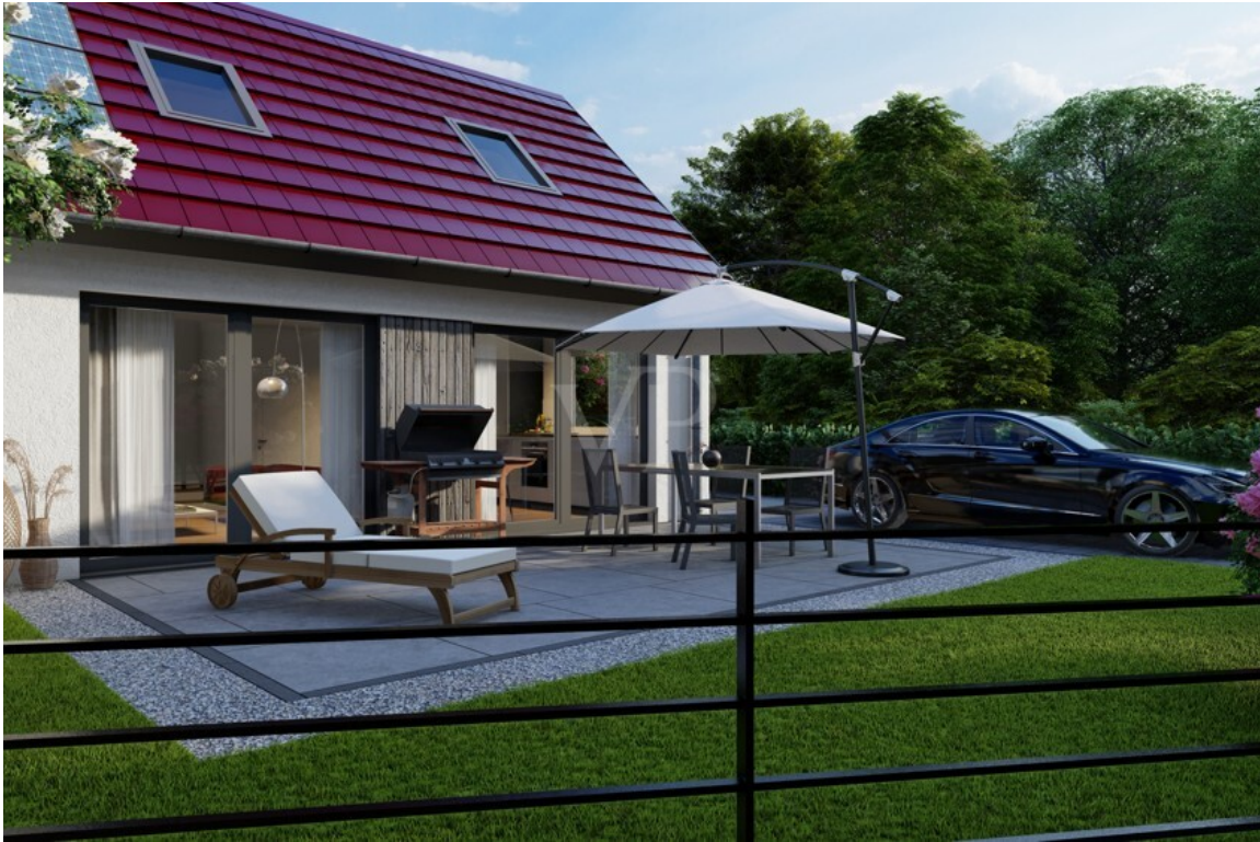
Terrasse und Garten